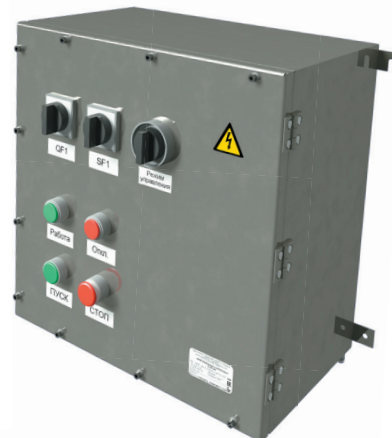
Шкаф SSCPE в корпусе из нержавеющей стали AISI316